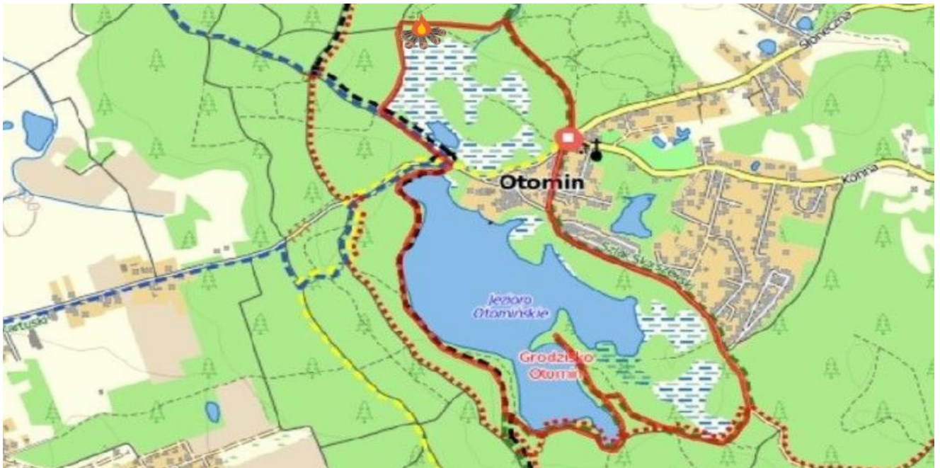
Ryc.1. Planowana trasa Rajdu (oznaczona linią ciągłą w kolorze czerwonym), miejsce na ognisko zaznaczono sygnaturą.